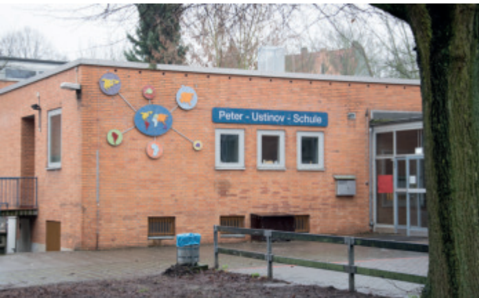
Die Oberschule Peter Ustinov in Ricklingen ist mit Schulverweigerung konfrontiert.

Die Brennpunktschule Peter Ustinov in Ricklingen soll einen Bildungslotsen für Romakinder und einen für Arabisch sprechende Kinder erhalten, der ihnen in allen Fragen zur Seite steht. Das beschloss der Schul- und Bildungsausschuss einstimmig auf Antrag der Gruppe LINKE & PIRATEN. Hintergrund ist eine wachsende Zahl von SchülerInnen, die der Oberschule fernbleiben. Die BildungslotsInnen räumen nicht nur Sprachbarrieren zwischen Eltern, welche die deutsche Sprache nicht verstehen, SchülerInnen und der Schulverwaltung aus dem Weg. Die BetreuerInnen suchen die Kinder und Jugendlichen oft zu Hause in den Unterkünften auf, helfen beim Ausfüllen von Formularen und sind dann AnsprechpartnerInnen vor allem für die Eltern. Eine Bildungslotsin für die arabischsprachigen Kinder gab es schon einmal an der Schule. Als die Stelle gestrichen wurde, gingen die Flüchtlingskinder nach und nach nicht mehr zur Schule.