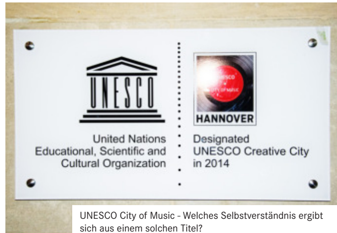
UNESCO City of Music - Welches Selbstverständnis ergibt sich aus einem solchen Titel?

RATS-KOMPASS: Was sollte Ihrer Meinung nach mit dem alten Schwimmbadgebäude geschehen?