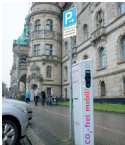
Ladesäule für Elektrofahrzeuge am Rathaus

W ohnhäuser mit drei Geschossen und mehr sollen künftig Ladesäulen für Elektrofahrzeuge erhalten. Das beschloss der Bezirksrat Misburg-Anderten einstimmig auf Antrag der Gruppe LINKE & PIRATEN. Die Verwaltung solle die Einrichtung von E-„Zapfsäulen“ bei der Aufstellung von Bebauungsplänen berücksichtigen, heißt es im Antrag. Die KommunalpolitikerInnen wollen so ein dichtes Ladenetz im Stadtbezirk schaffen. Der Volkswagenkonzern geht davon aus, dass schon im Jahr