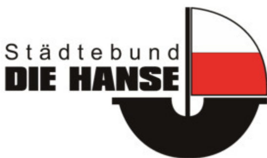
Logo: Städtebund DIE HANSE

Die Verwaltung soll die Kosten und den Nutzen einer Mitgliedschaft Hannovers im internationalen Städtebund DIE HANSE prüfen. Das beschloss der Rat auf Initiative der Gruppe LINKE & PIRATEN. Im Gegensatz zur historischen Handels- und späteren Städtehanse, die vor allem ihre Kaufleute vor Ungesetzlichkeit und Willkür im Ausland schützte, soll das zeitgenössische Hanse-Netzwerk den Austausch fördern und vor allem TouristInnen in die Städte locken.