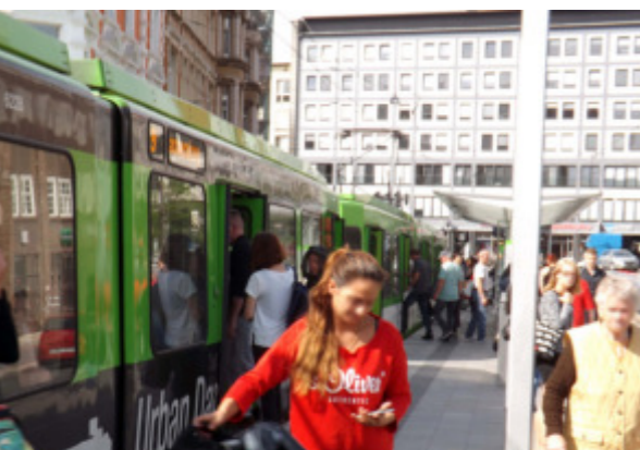
Selbst vormittags in der Woche steigen an der Stadtbahnhaltestelle Schwarzer Bär viele Fahrgäste ein und aus.

Seit die Stadtbahnlinien 3 und 7 die Haltestelle Schwarzer Bär nur noch im Nachtsterverkehr bedienen, sind die Bahnen der Linie 9 vor allem abends und am Wochenende überfüllt, wenn sie Linden-Mitte ansteuern. Auch an der Haltestelle Schwarzer Bär herrscht dichtes Gedränge. Der Grund sind meist Events im Veranstaltungszentrum Capitol und im Tanz- und Konzertclub Lux. PIRATEN-Bezirksratsherr Thomas Ganskow will das ändern. Auf seine Initiative beschloss der Bezirksrat Linden-Limmer einstimmig, die Region als für den Öffent-