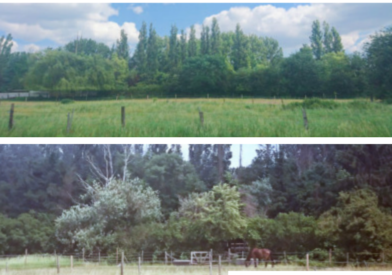
Naherholungsgebiet Steinbruchsfeld Ost.

zu bebauen. Auf der knapp acht Hektar großen Fläche sind 250 bis 400 Wohnungen in vorzugsweise zwei- und dreigeschossiger Bauweise geplant. Bisher stehen dort nur wenige Einzelhäuser. Für die Umsetzung der Pläne müssten ein kompletter Wald abgeholzt werden sowie zwei Teiche und zahlreiche Tierarten wie Fledermäuse weichen. Auch eine jahrzehntealte Kleingartenkolonie fiele den städtischen Plänen zum Opfer.