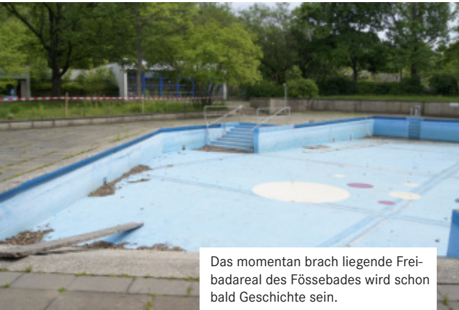
Das momentan brach liegende Freibadareal des Fössebades wird schon bald Geschichte sein.