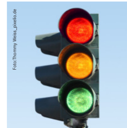
Das Ampelbündnis in Hannover - in der Schulpolitik zwischen Konfusion und Arbeitssimulation.