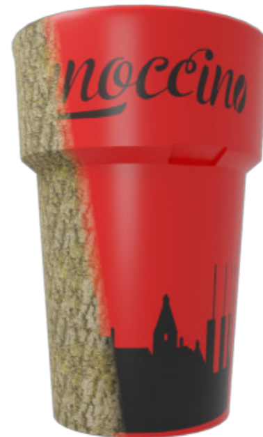
Aus Rinde gemacht: Der Hannoccino - über den Namen und die Gestaltung mag man streiten, die Idee aber ist sinnvoll.

fen. Verdreckte Straßen und Grünflächen sowie überquellende Abfallbehälter sind die Folge. Um der vor allem durch eilige Kaffeetrinker/innen verursachten Berge von Einwegmüll Herr zu werden, führen Stadt, Region und der Abfallentsorger aha einen Mehrwegbecher ein. Dafür wurde der Bechertyp Hannoccino entwickelt, der mit einem Pfand von zwei Euro belegt ist. Als Partner für die Aktion und damit Annahme- und Ausgabestellen für den Pfandbecher konnte man bisher Hannover 96, das Congress-Centrum und die Bäckerei gewinnen. Weitere Unternehmen sollen folgen, ihre Teilnahme an der Aktion ist freiwillig.